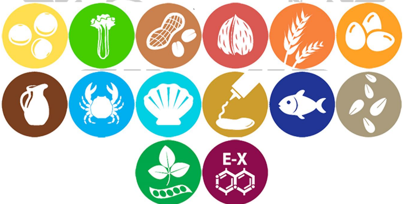
TABLA DE ICONOS SEGÚN ALERGENOS MARCADOS EN LA CARTA

ANTES DE TOMAR NOTA, NOS TENDRAN QUE AVISAN DE SU ALERGIA O INTOLERANCIA - LOS PRECIOS ESTAN PUBLICADOS EN LA CARTA PRINCIPAL CON I.V.A. INCLUIDO -